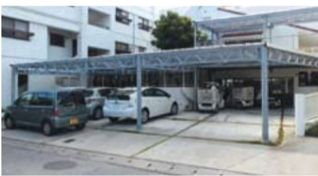
カーポートの屋根などを有効活用する動きも広がっています

しかも買取価格・期間は年度ごとに見直され、現行の「42円・20年」の設定が来年度以降も継続する保証はないため、検討するならば「善は急げ」で取りかかったほうがよさそうです。